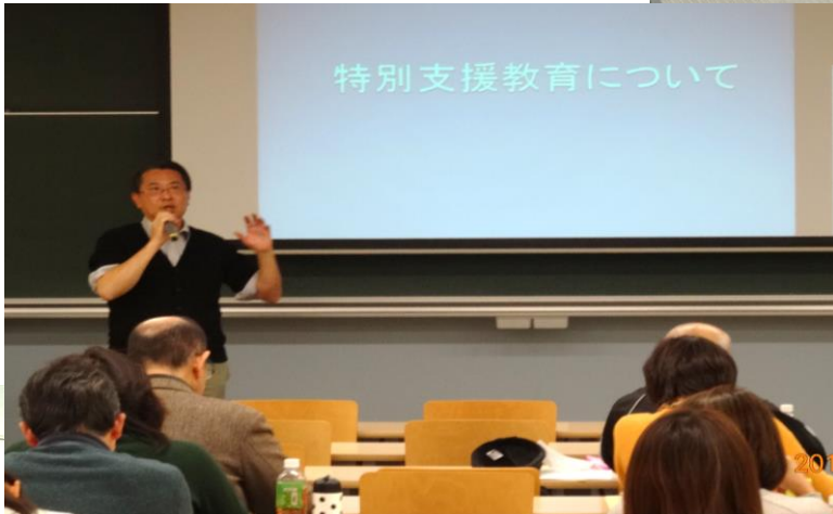
レゼンの学生さんよりのプ