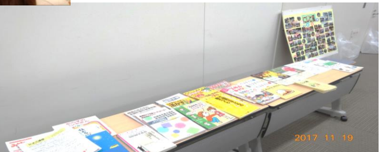
展示 参考図書や事業所パンフレット