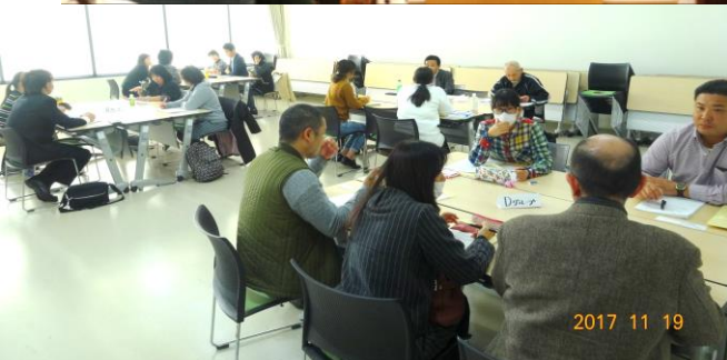
グループワーク 10グループ3教室に分かれて